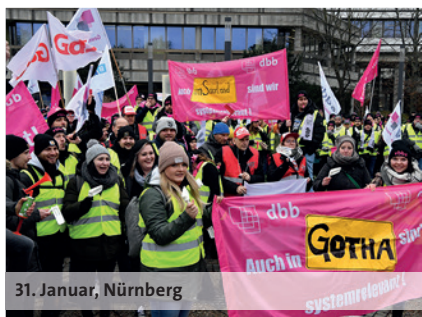
31. Januar, Nürnberg

dbb: wir. für euch. 10,5% 500 Euro mindestens