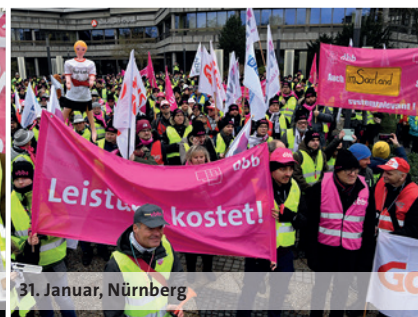
31. Januar, Nürnberg