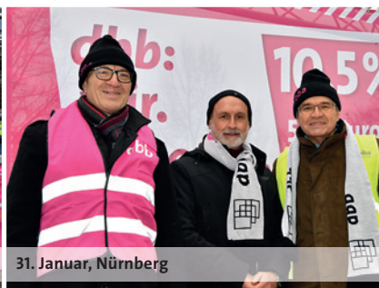
31. Januar, Nürnberg