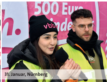
31. Januar, Nürnberg