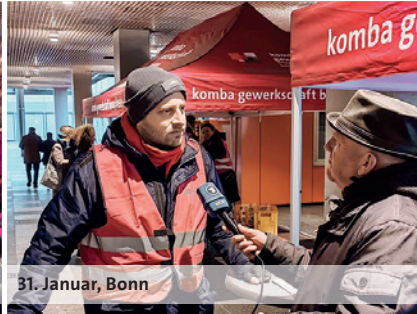
31. Januar, Bonn