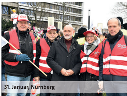
31. Januar, Nürnberg