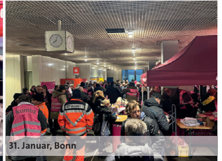
31. Januar, Bonn