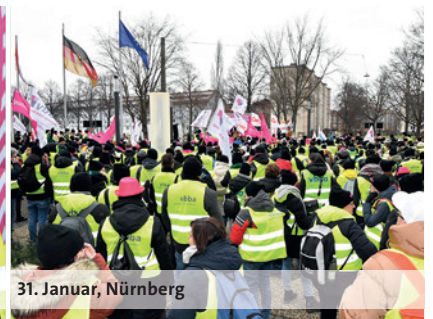
31. Januar, Nürnberg