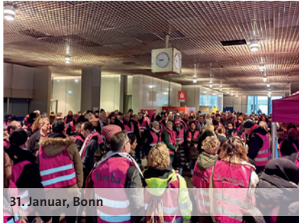
31. Januar, Bonn