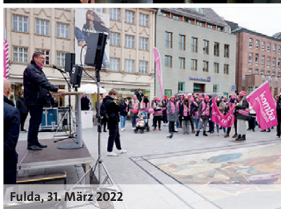
Fulda, 31. März 2022