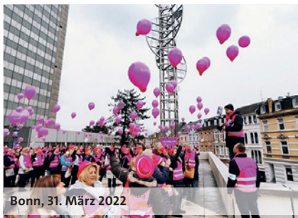
Bonn, 31. März 2022