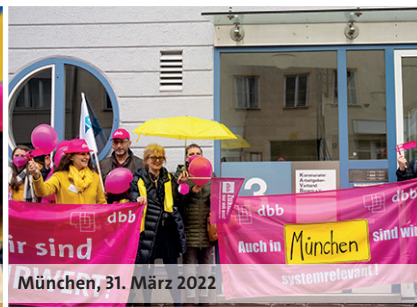
München, 31. März 2022

Perspektiven geschaffen und Entlastungen sichergestellt werden. Der Arbeitsalltag sei schon vor Corona fordernd gewesen. Bei beiden Kolleginnen wurde deutlich, wie groß das Engagement der Beschäftigten ist, dass aber gleichzeitig der Frust wächst, mit den berechtigten Forderungen nicht ernstgenommen zu werden. Spürbar wird auch, dass es den Kolleginnen und Kollegen nicht allein um ihre eigene Arbeit geht, sondern auch darum, Erziehungs- und Sozialarbeit bestmöglich und im Sinne der Menschen, die sie in Anspruch nehmen müssen, zu gestalten.