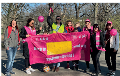
Leipzig, 28. März 2022