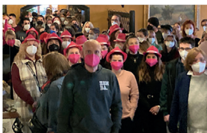
Nürnberg, 30. März 2022