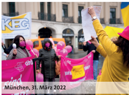
München, 31. März 2022