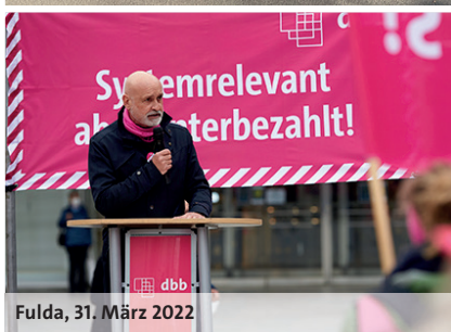
Fulda, 31. März 2022