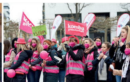
Fulda, 31. März 2022