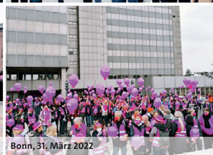
Bonn, 31. März 2022