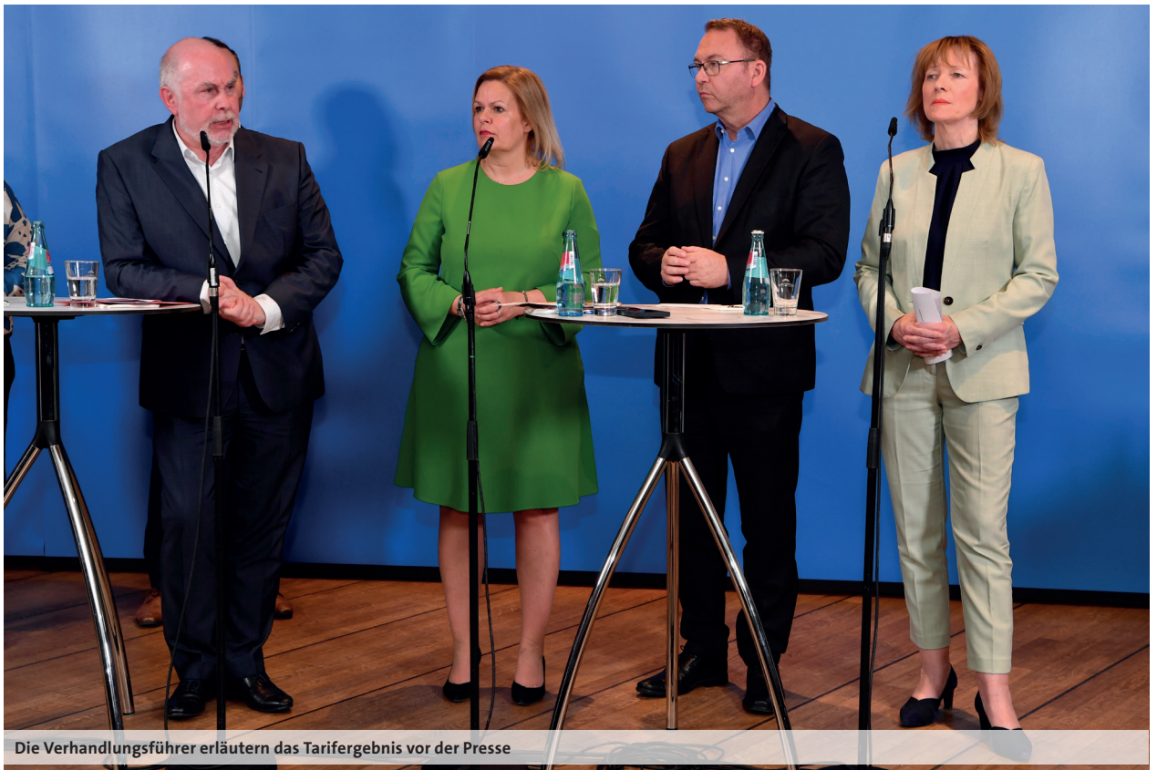
Die Verhandlungsführer erläutern das Tarifergebnis vor der Presse